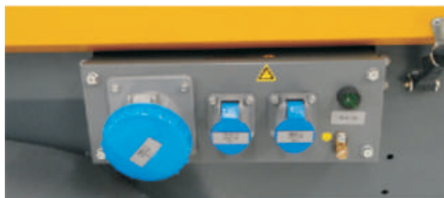
Saída de energia